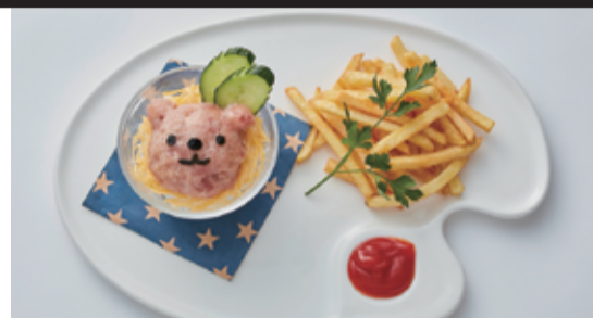
104 キッズ ネギトロご飯 (小学生以下のお子様に限らせていただきます。)