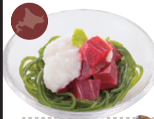
43 むかわ町中澤農園 だるま芋の まぐろの山掛け 厚岸昆布麺添え