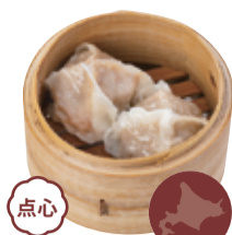
点心 35 北海道産 豚肉の粗挽き肉焼売