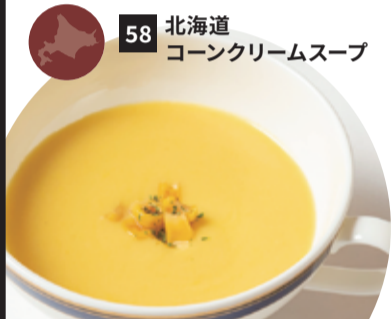
58 北海道 コーンクリームスープ