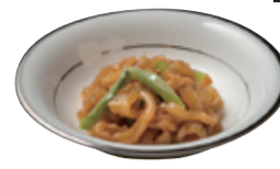
39 コリコリ食感 クラゲの中華風 和え物