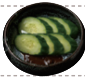
47 自家製 胡瓜の浅漬け もろ味噌添え