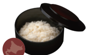
北海道産米 “ななつぼし”