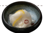
46 自家製 大根の千枚漬け