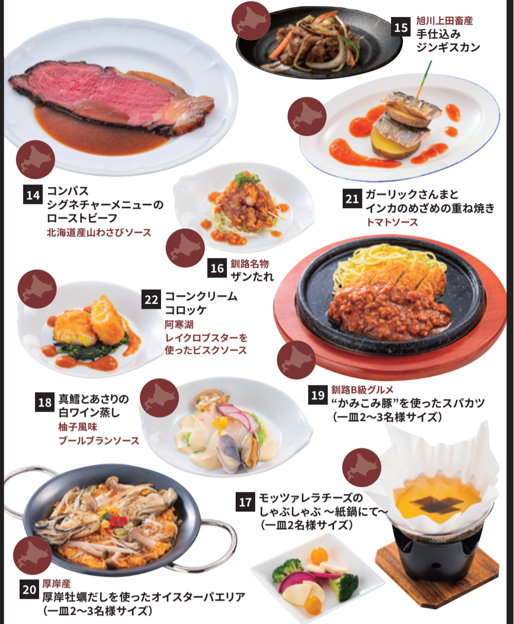
14 コンパス シグニチャーメニューの ローストビーフ 北海道産山わさびソース

素材の持ち味を大切に、 一つひとつ丁寧に作り上げた逸品。 温かいうちにお召し上がりください。