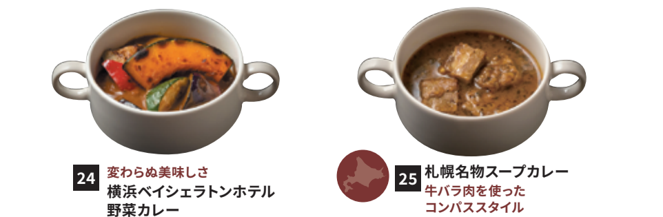
24 変わらぬ美味しさ 横浜ベイシエラトンホテル 野菜カレー