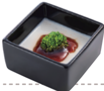
45 白子豆腐 菜の花とポン酢ジュレ