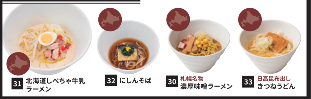
31 北海道しべちゃ牛乳 ラーメン