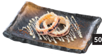
50 いか焼き マヨネーズ