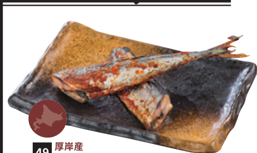
49 厚岸産 ピリ辛さんま