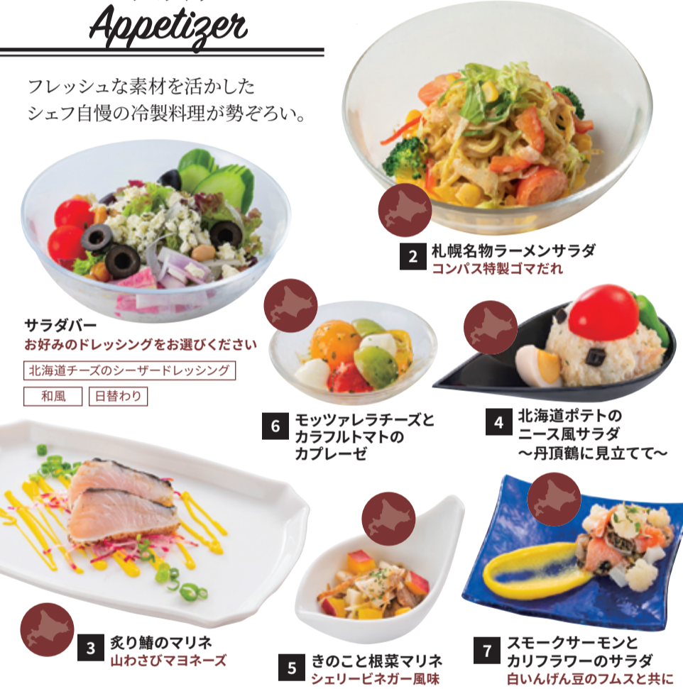
サラダバー お好みのドレッシングをお選びください 北海道チーズのシーザードレッシング 和風 日替わり