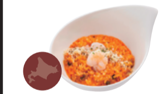
72 海老ときのこの トマトクリームリゾット