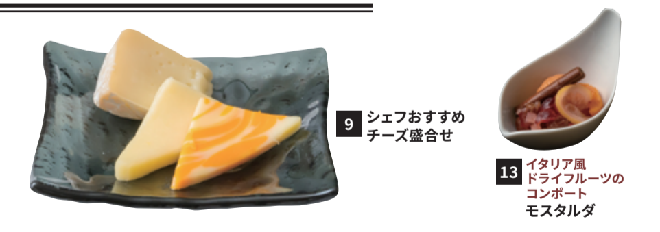
9 シェフおすすめ チーズ盛合せ