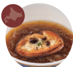
60 北海道北見の オニオンスープ チーズクルトン添え