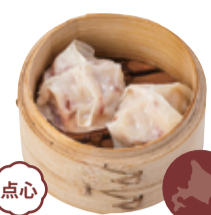
点心 34 北海道産 たこ焼売