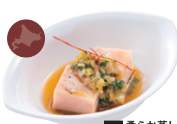
38 柔らか蒸し鶏 アイヌ葱とザーサイのソース