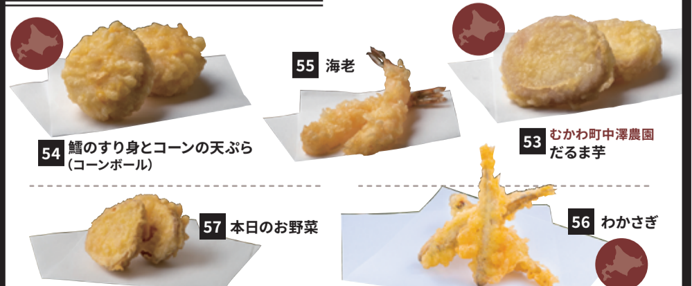
54 鱈のすり身とコーンの天ぷら (コーンボール)