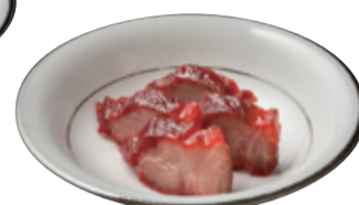
40 自家製チャーシュー