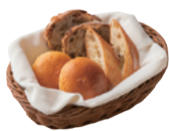
ホテルベーカリーで 焼き上げたパン各種