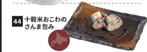
44 十穀米おこわの さんま包み