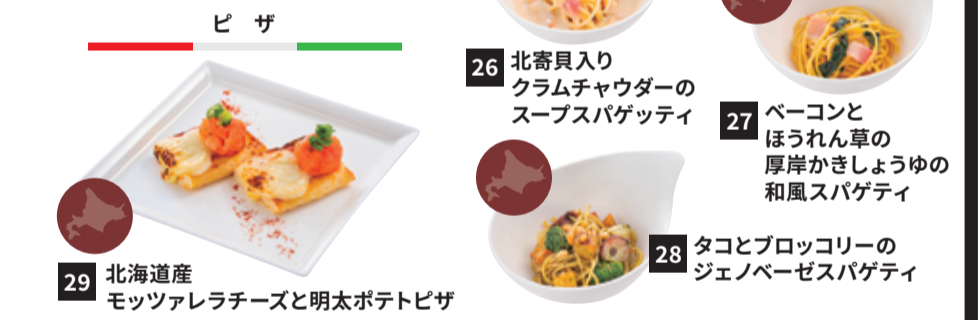
29 北海道産 モッツアレラチーズと明太ポテトピザ