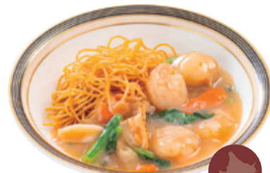
37 厚岸産 オイスターソースを 使った海鮮焼きそば